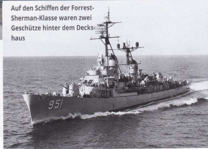
Die Turner Joy in ihrer aktiven Dienstzeit, aufgenommen 1962