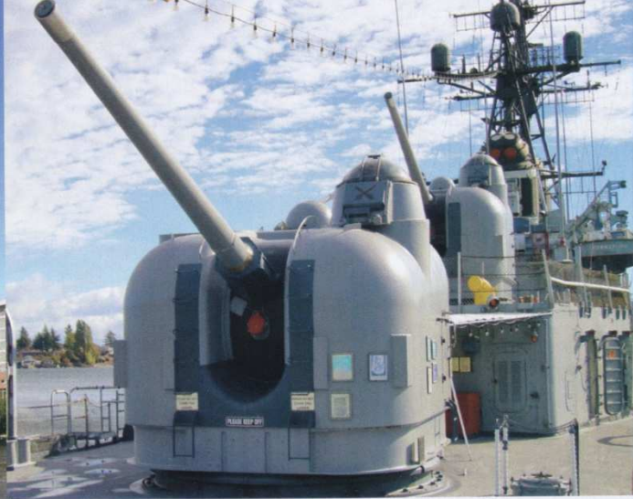
Auf den Schiffen der Forrest-Sherman-Klasse waren zwei Geschütze hinter dem Deckshaus

Die Bremerton Historic Ships Association erwarb den Zerstörer und machte ihn in Bremerton als Museumsschiff der Öffentlichkeit zugänglich. Zusätzlich zu den hier veröffentlichten Fotos habe ich noch ca. 60 weitere Detailfotos gemacht, diese stelle ich Interessenten gerne zur Verfügung. Kontakt bitte über die Redaktion.