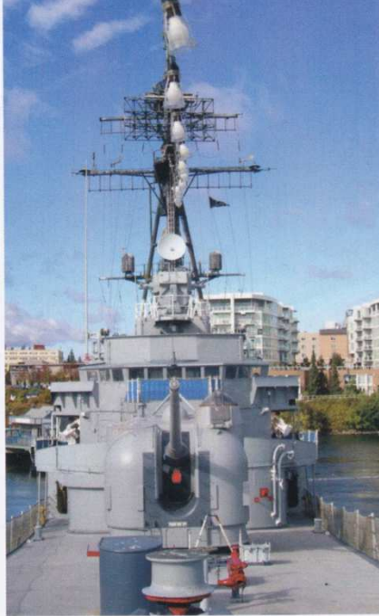
Das Vorschiff mit dem Kaliber-54-Geschütz vor der Brücke

schen Küste oder unterstützte Landoperationen durch Artilleriebeschuss. Nach dem Ende des Vietnamkrieges wurde sie 1974/1975 generalüberholt und fuhr bis zur Außerdienststellung am 22.11.1982 weiterhin im Pazifik. 1990 wurde die Turner Joy aus dem Schiffsregister der US Navy gestrichen.